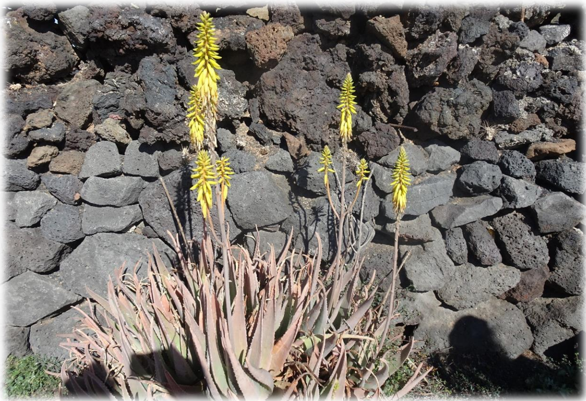
Aloe Vera is een veel voorkomende plant in Lanzarote. Evenwel zie hem zelden in bloei staan. Het plantensap wordt in cosmetica zoals crèmes en lotions verwerkt. Het vruchtvlees