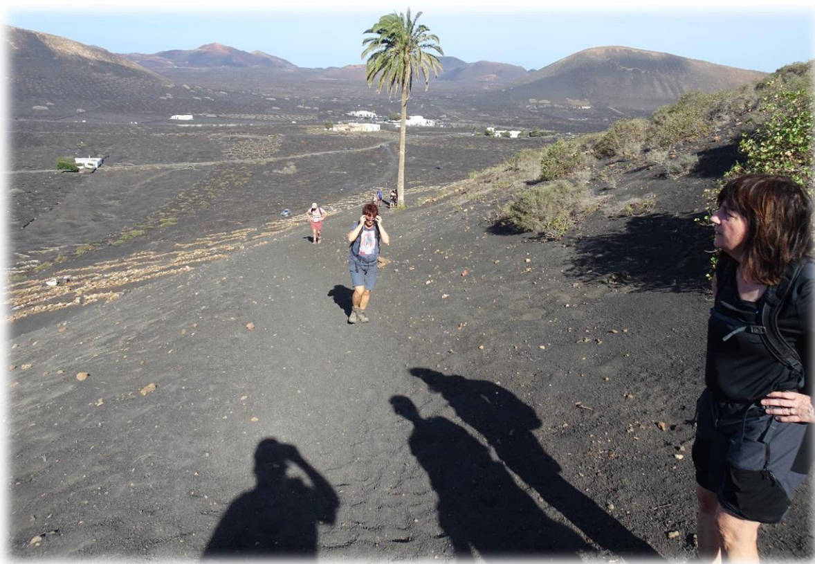
Aan de randen van dit lavaveld heeft zich een uniek wijngaardveld gevormd van miljarden kleine steentjes van vulkanische as ("lapilli" of picon genaamd). In dat pikzwarte gloeiende