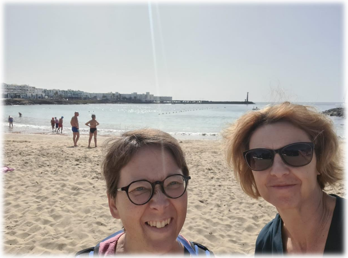
In Costa Teguisé kunnen we genieten van zee en strand.