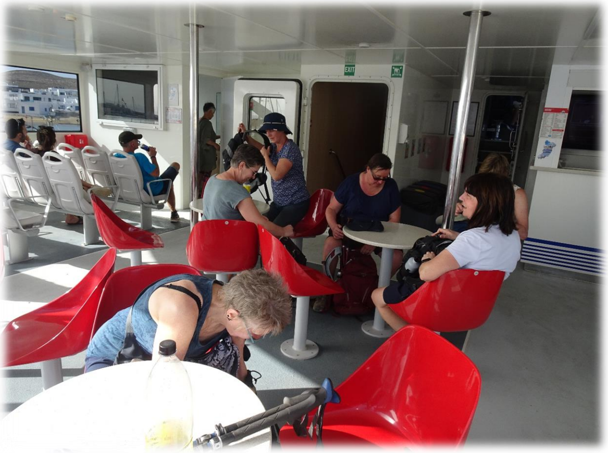
Moe maar voldaan verlaten we het zustereiland van Lanzarote.