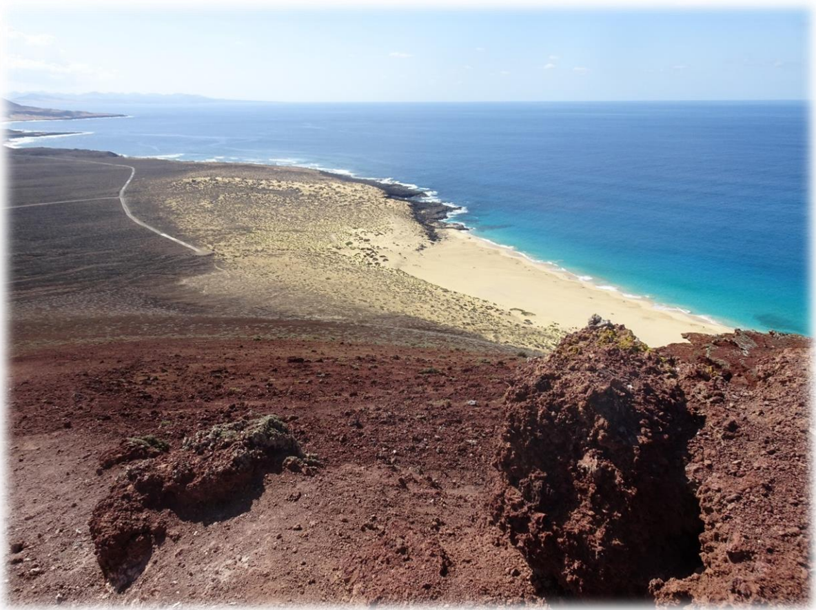
Vanop de top hebben we zicht op het gehele eiland La Graciosa en de omliggende eilandjes.