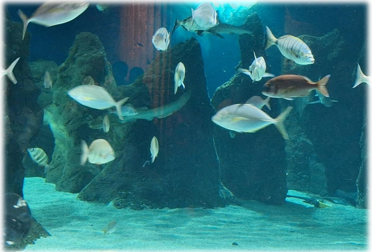
In de buurt van ons hotel kan er een aquarium worden bezocht.