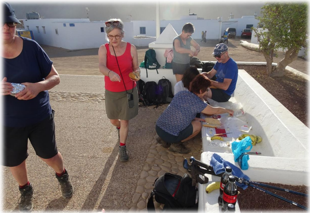
In de plaatselijke supermarkt doen we aankopen voor de picknick en buiten aan de kerk maken we onze picknick. Het is dus terug smeren maar dit keer geen zonnecrème.