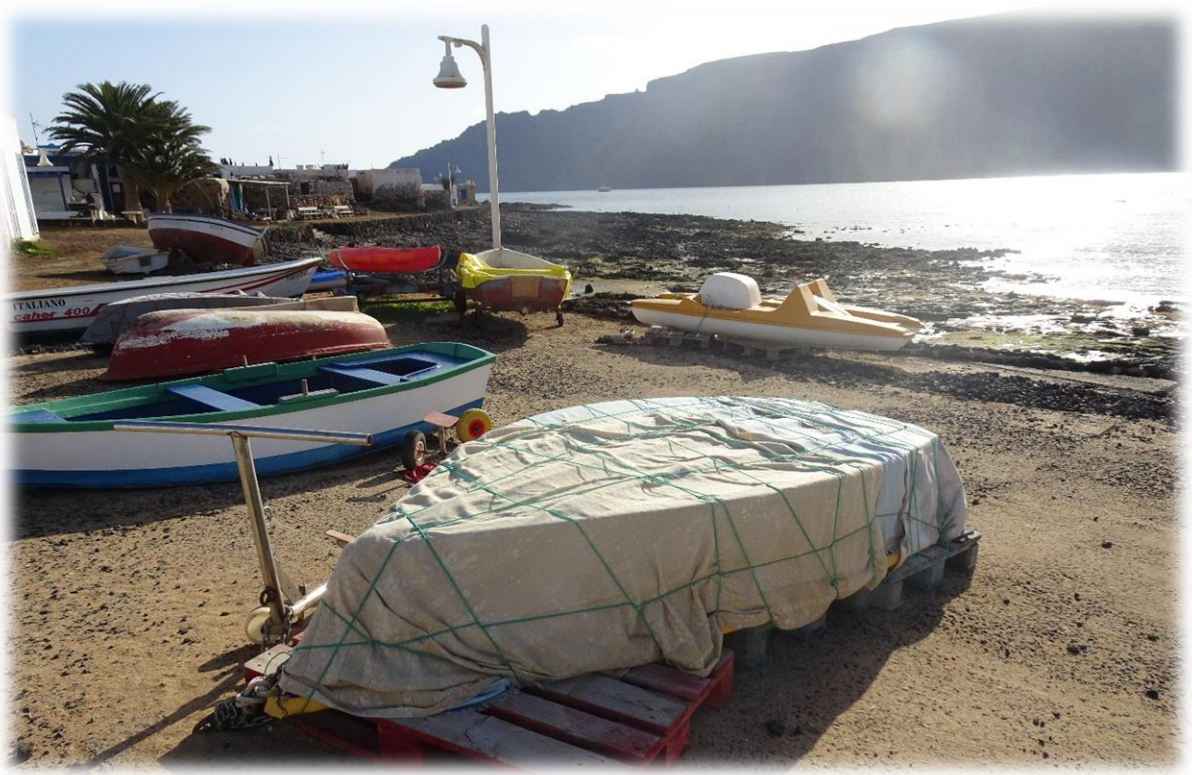
La Graciosa is een van de kleinere Spaanse eilanden in de eilandengroep van de Canarische Eilanden. La Graciosa ligt ongeveer twee km ten noorden van Lanzarote en wordt gescheiden door de zeestraat El Rio.