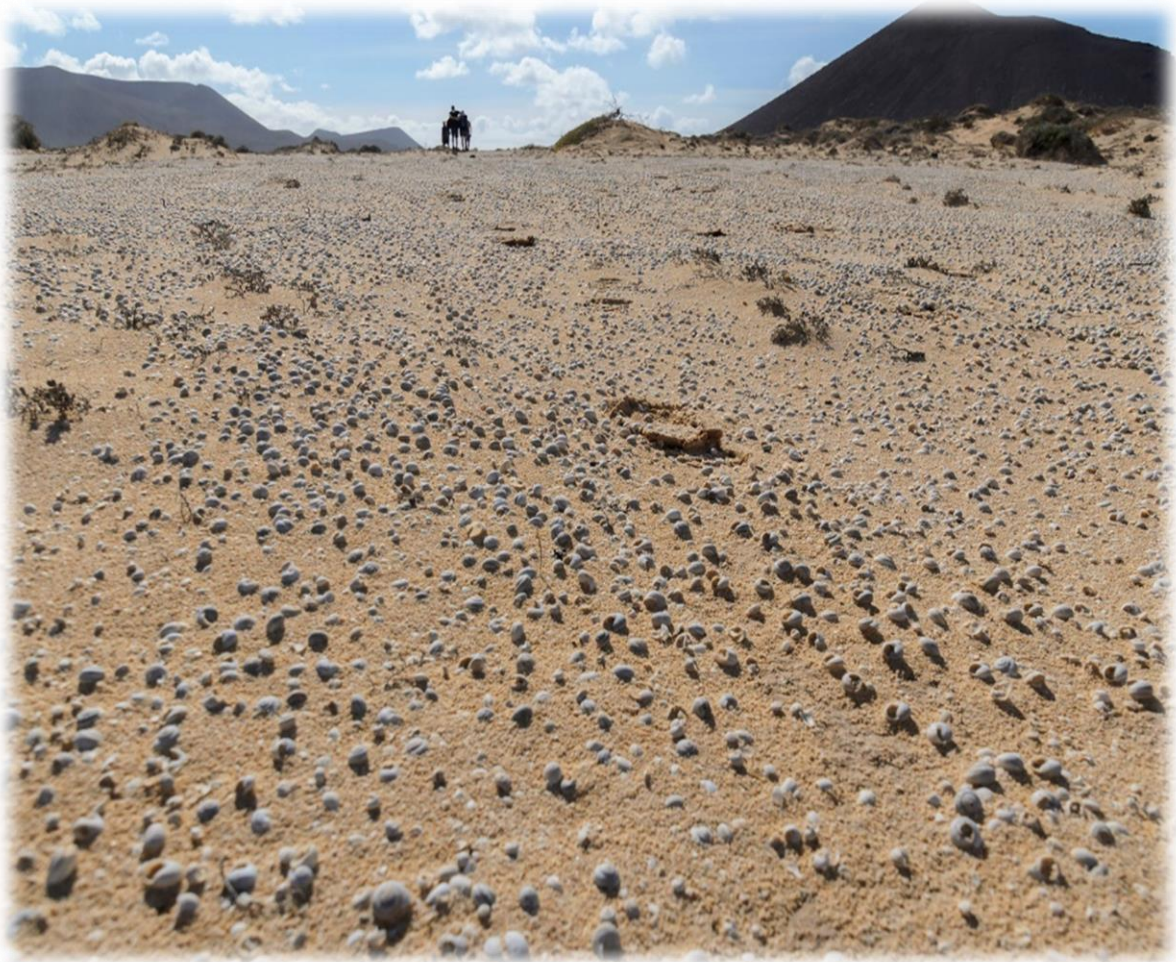
Miljarden schelpjes liggen aangespoeld op de stranden. Het zijn zeeslakjes.