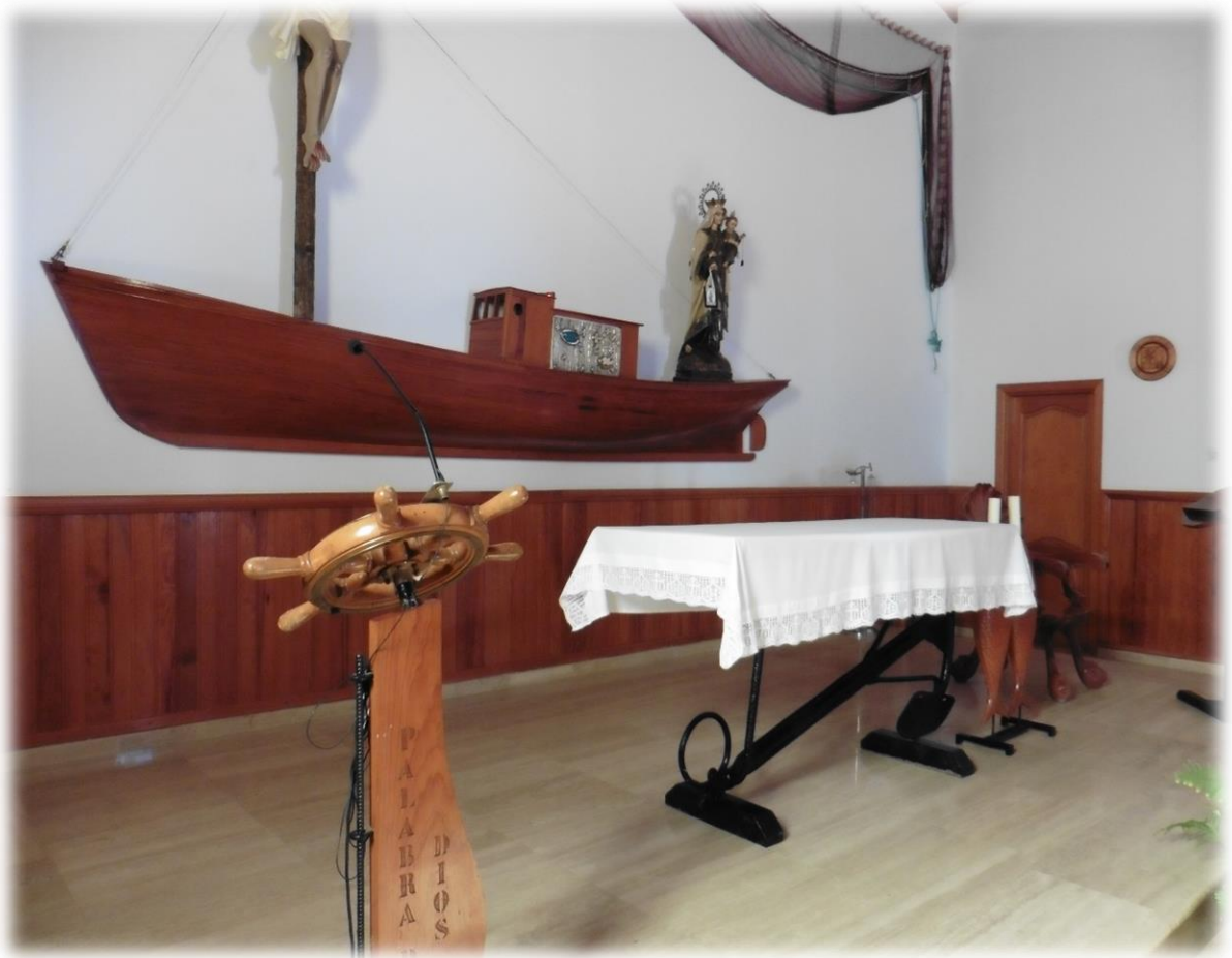
Het blad van het altaar rust op een scheepsanker.