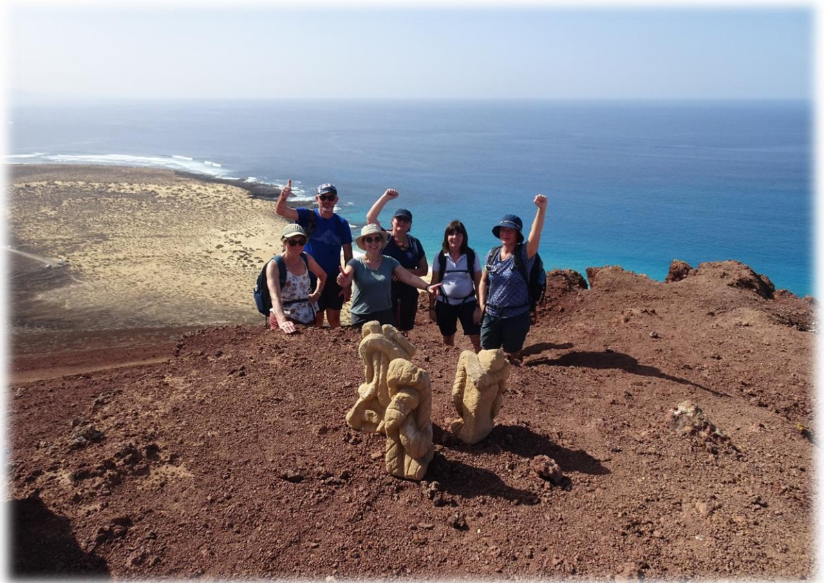
Enkele dapperen van onze groep beklimmen de Montana Bermeja (157 m). Op de top staan er enkele beeldhouwwerken van een plaatselijke kunstenaar.